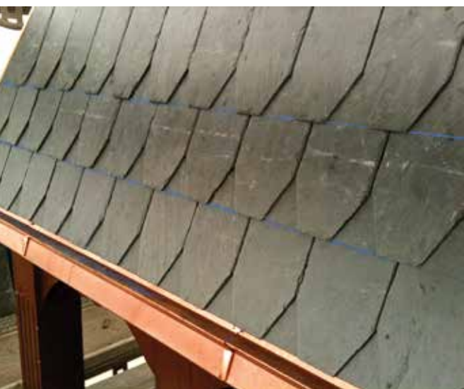
Skiferarbejde på Sankt Lukas Kirken.

Der er ikke tale om et uddøende håndværk, forsik-