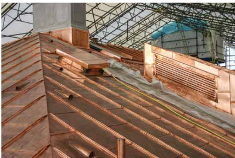
Kobberarbejde på Carlsbergfondets bygning på H.C. Andersens Boulevard.