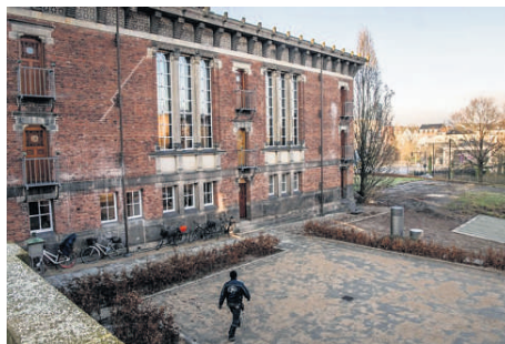
Det tidligere Erhvervsarkiv, tegnet af Hack Kampmann, har gennemgået en renovering og er nu en del af Retten i Aarhus.

gået til restauranten Noma, snedkerværkstedet Egeværk og Kongehallen i Saglandet Lejre.