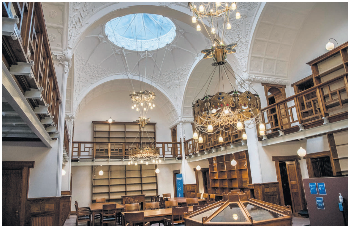
Den ærefulde håndværkspris, Snedkerprisen, går i år til arbejdet med at renovere Smykkeskrinet på Vester Allé i Aarhus.

Nu har politiet altså fået fire drenge i tale, som godt en måned efter episoden har meldt sig selv.