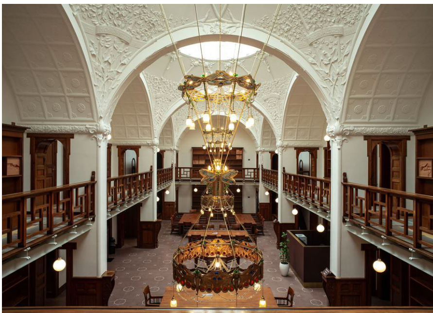
Lofter, lysekroner og møbler i læsesalen i det gamle stadsbibliotek er blevet restaureret nænsomt. Bøgerne er væk, men reolerne består. Selv om der er foretaget en væsentlig omlægning af funktionerne i bygningen for snart 60 år siden og nu igen, så er det sket med nænsom hånd.

Det er der grund til at glæde sig over, især fordi jeg i 2018 i denne avis beklagede