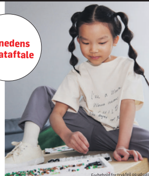
Forbehold for trykfejl og udsving